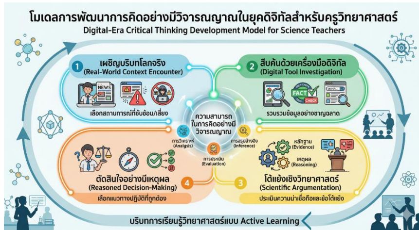
ภาพที่ 2 โมเดลการพัฒนาการคิดอย่างมีวิจารณญาณในยุคดิจิทัลสำหรับครูวิทยาศาสตร์